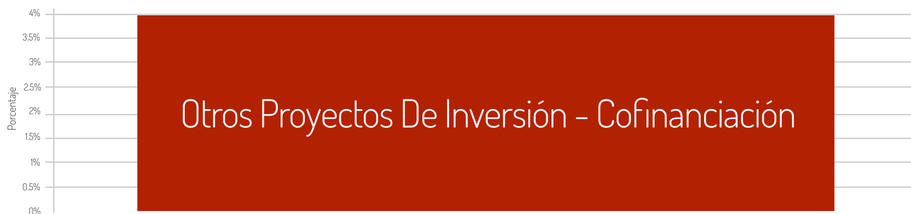
Otros Proyectos de Inversión - Cofinanciación (22310)